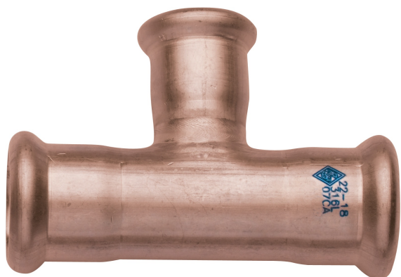
Raccordo a T femmina ridotto.