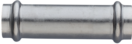
Manicotto femmina passante.