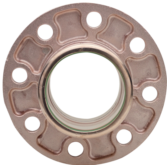
Manguito bridado PN10/16.