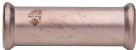
Manguito de paso.