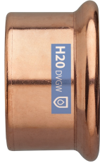
Tapón H de cobre.