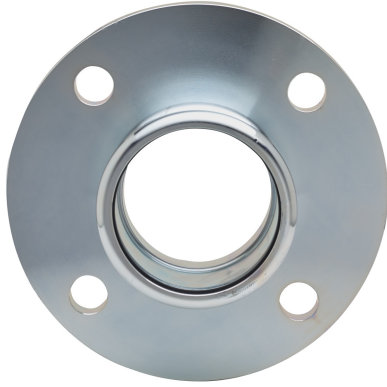
Manguito bridado H PN16.