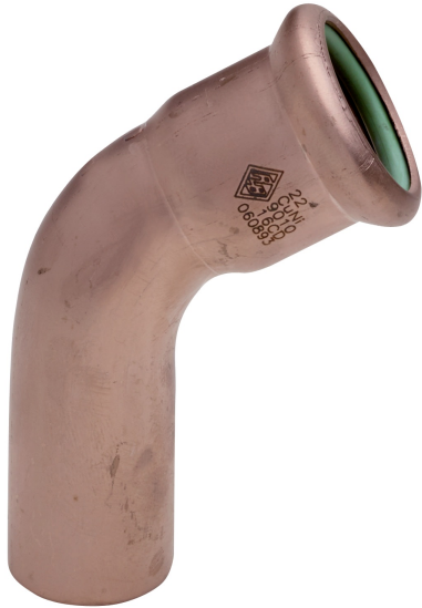
M/F 60° elbow.