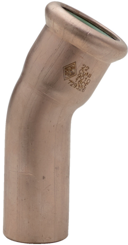
Winkelstück 15° I/A.