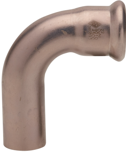
Bogen 90° I/G.