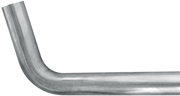
Gebogene Rohrstücke A/A 75°.