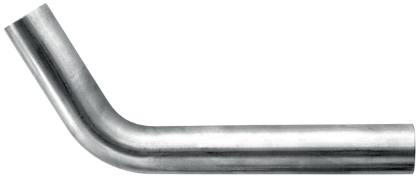
Gebogene Rohrstücke A/A 60°.