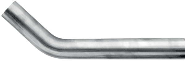
Gebogene Rohrstücke A/A 45°.