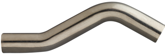
Überbogen kurz A/A.